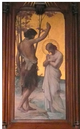
T. Tollet, Le Baptême du Christ , 1901