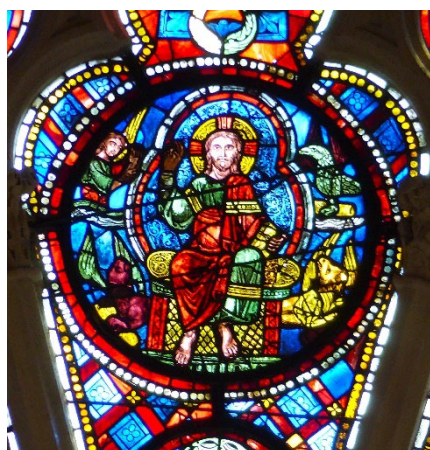
Au sommet des voussures du portail central