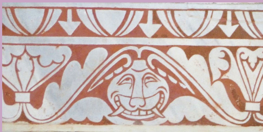
Frise en scagliole dans le chœur (détail)

Triforium : étroite galerie aménagée dans l'épaisseur des murs, au-dessus des bas-côtés. Le triforium de la primatiale parcourt l'ensemble de l'édifice.