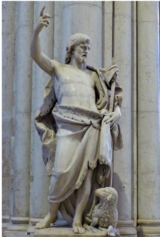
B. Blaise, Saint Jean-Baptiste , 1780