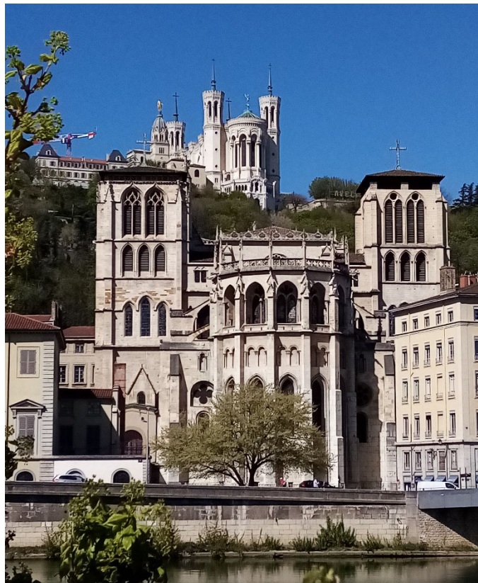
Cathédrale Saint-Jean-Baptiste, chevet