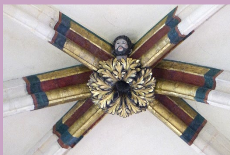
À 32.50 m du sol, visage dans une clé de voûte