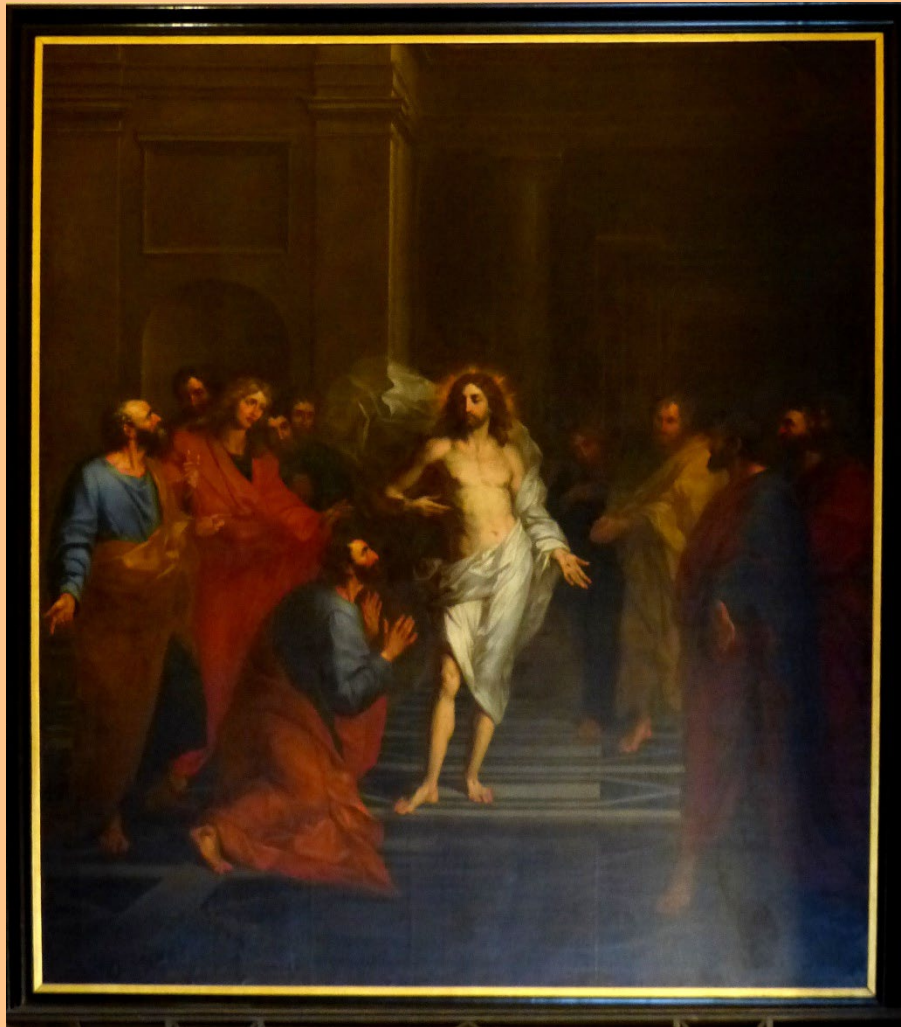
Arnould de Vuez, L'incrédulité de saint Thomas , 1693, 5 m x 3,30 m

Cette toile est un may de Notre-Dame de Paris. Les mays sont de grands tableaux offerts à la cathédrale de Paris par la corporation des orfèvres de la capitale, chaque 1 er mai de 1630 à 1707. Cette peinture a été offerte en 1693 par les orfèvres Claude Ballin et Pierre Creuzet. Saisi sous la Révolution, il est racheté par le Cardinal Fesch, oncle de Napoléon Bonaparte et archevêque de Lyon, et offert à la cathédrale Saint-Jean-Baptiste.