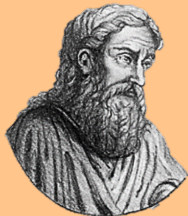
Sidoine Apollinaire, G. Mercier, 1878

Ses lettres constituent, au milieu du 5 e siècle, la première source d'importance pour la topographie urbaine et religieuse de Lyon.