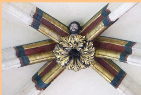
À 32.50 m du sol, visage dans une clé de voûte