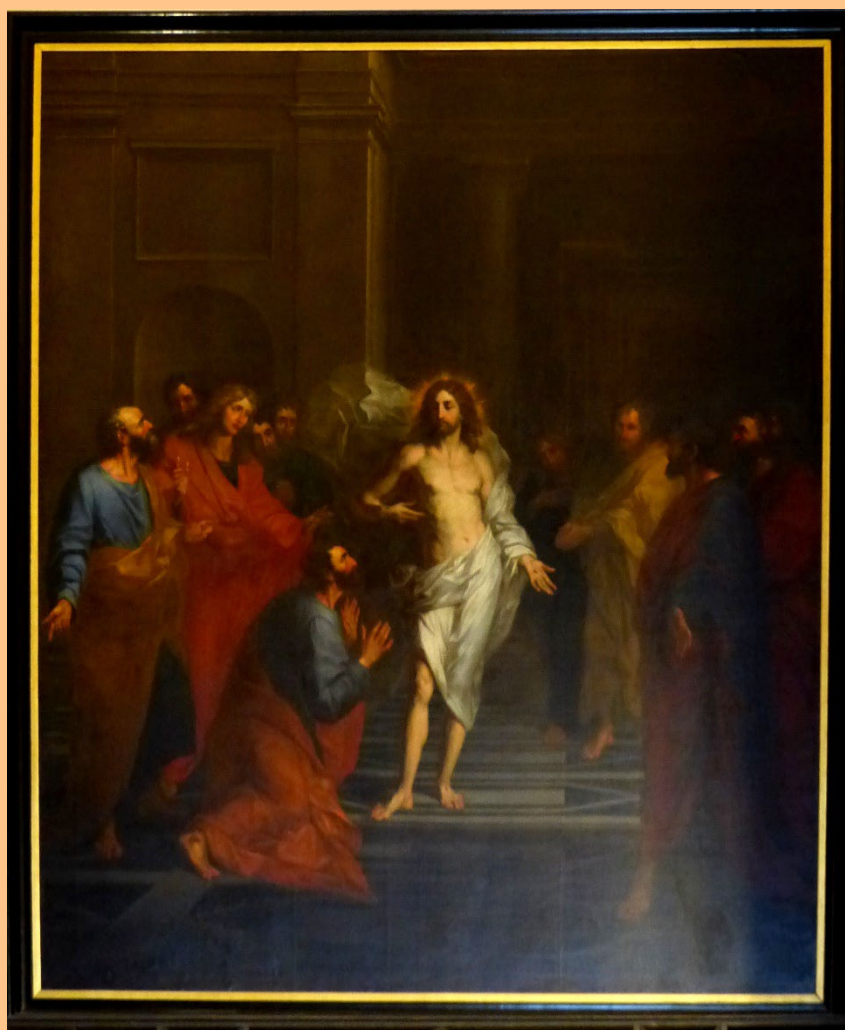
Arnould de Vuez, L'incrédulité de saint Thomas , 1693, 5 m x 3,30 m

Cette toile est un may de Notre-Dame de Paris. Les mays sont de grands tableaux offerts à la cathédrale de Paris par la corporation des orfèvres de la capitale, chaque 1 er mai de 1630 à 1707. Cette peinture a été offerte en 1693 par les orfèvres Claude Ballin et Pierre Creuzet. Saisi sous la Révolution, il est racheté par le Cardinal Fesch, oncle de Napoléon Bonaparte et archevêque de Lyon, et offert à la cathédrale Saint-Jean-Baptiste.