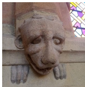
Dans le triforium...