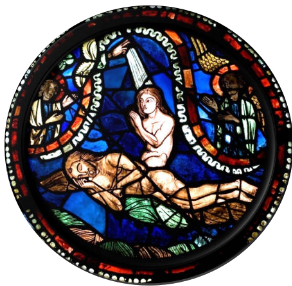
Médailon Création d'Eve , rosace sud, XIIIe siècle.

Aborder les notions d'espace et de temps, comprendre la diversité des représentations du monde (domaine 5, Les représentations du monde).