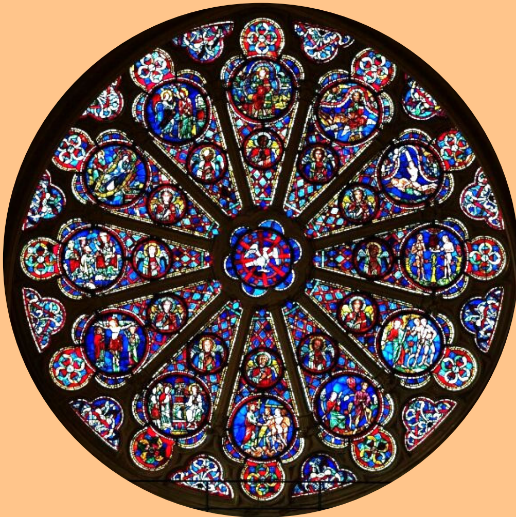
Rosace du transept sud, dite Des deux Adam

Les rosaces du transept datent du XIII e siècle. Celle du sud représente le cycle des deux Adam symbolisé dans douze médaillons : au sommet se trouve le Christ pantocrator. Dans la partie de droite est racontée l'histoire d'Adam et Ève, de leur création à leur travail devenu nécessaire et leur mort. Dans la partie de gauche, de haut en bas, est retracée l'histoire de Jésus, de l'Annonciation à Marie jusqu'à sa résurrection. C'est le nouvel Adam . Sont ainsi représentées les vies en miroir du premier homme créé et du Rédempteur.