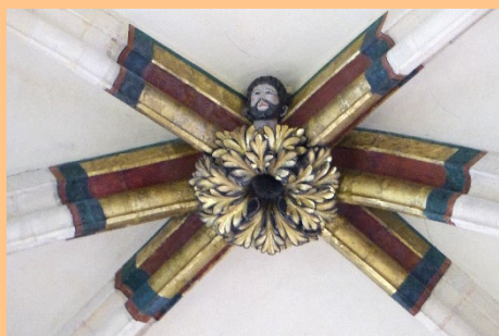
À 32.50 m du sol, visage dans une clé de voûte