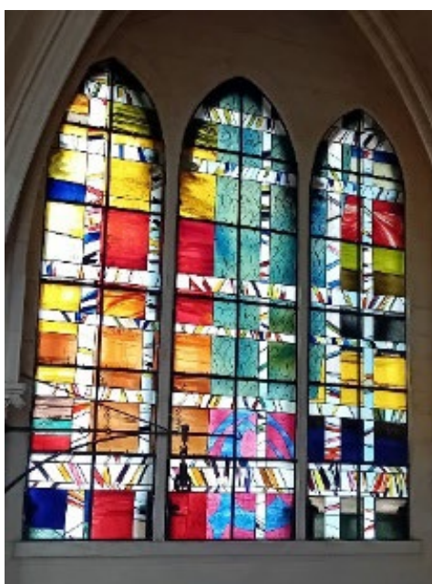
Dans le transept nord, vitraux du XXe siècle