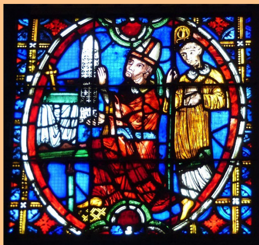
Renaud II de Forez, commanditaire des verrières du chœur au XIIIe siècle

1937-1965 : Pierre Gerlier , cardinal, reconnu Juste parmi les nations par l'État d'Israël. Il lance la construction d'une cinquantaine d'églises dans le diocèse.