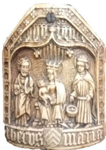
Baiser de paix , ivoire, Vierge à l'enfant et deux saints, 15 e siècle

Pour les plus curieux, de nombreux objets religieux médiévaux, notamment du 13e siècle, sont visibles dans le musée du Trésor de la cathédrale : crosses épiscopales, croix de procession, vêtements liturgiques... mais aussi tapisseries, tableaux, etc.