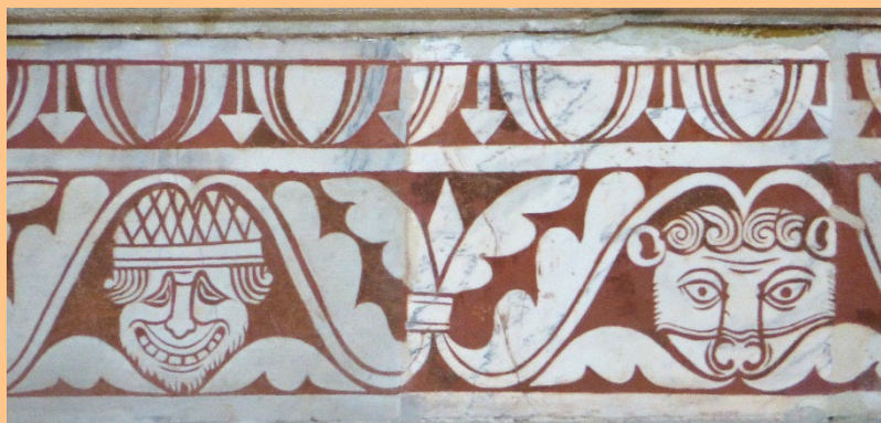
Frise en scagliole dans le chœur (détail)

Triforium : étroite galerie aménagée dans l'épaisseur des murs, au-dessus des bas-côtés. Le triforium de la primatiale parcourt l'ensemble de l'édifice.