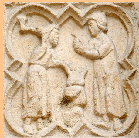
L'apprenti charpentier et son maître, portail sud, côté sud