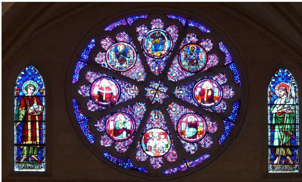
Petite rosace de l'entrée du transept, flanquée des vitraux de st Etienne et de st Jean-Baptiste