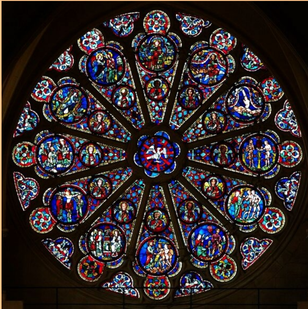
Rosace du transept sud, dite Des deux Adam

Les rosaces du transept datent du XIII e siècle. Celle du sud représente le cycle des deux Adam symbolisé dans douze médaillons : au sommet se trouve le Christ pantocrator. Dans la partie de droite est racontée l'histoire d'Adam et Ève, de leur création à leur travail devenu nécessaire et leur mort. Dans la partie de gauche, de haut en bas, est retracée l'histoire de Jésus, de l'Annonciation à Marie jusqu'à sa résurrection. C'est le nouvel Adam . Sont ainsi représentées les vies en miroir du premier homme créé et du Rédempteur.