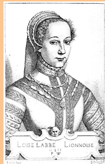
Louise Labé, P. Woëriot, 1555

Louise Labé (1524-1566) est surnommée « Louise Labé Lionnoise » ou « La Belle Cordière » (son père, puis son époux sont marchands de cordes). La poétesse écrit relativement peu de textes, en prose ou en sonnets. Elle fait partie des rares autrices de la Renaissance. Ces écrits célèbrent l'amour et la femme, défiant les conventions de son époque.