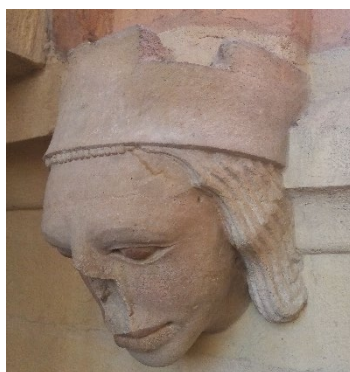
Dans le triforium...