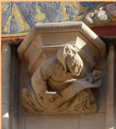
Horloge extérieure de la façade occidentale (détail)

Triforium : étroite galerie aménagée dans l'épaisseur des murs, au-dessus des bas-côtés. Le triforium de la primatiale parcourt l'ensemble de l'édifice.