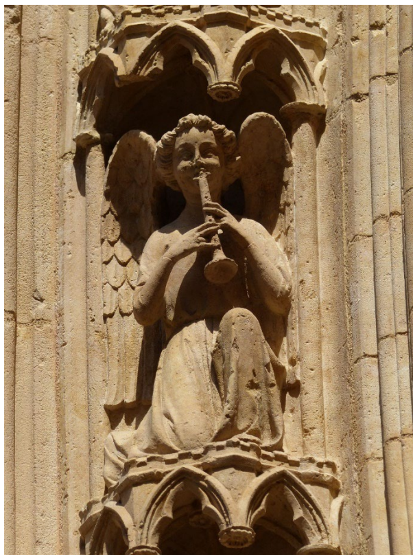
Voussure du portail central (détail), ange musicien