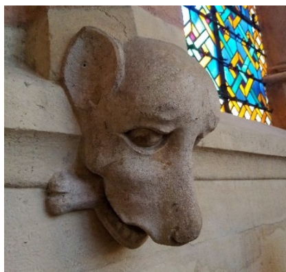
Triforium, tête de chien