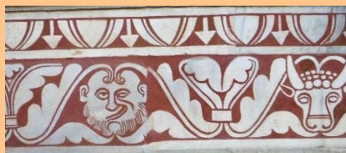
Frise en scagliole dans le chœur (détail)